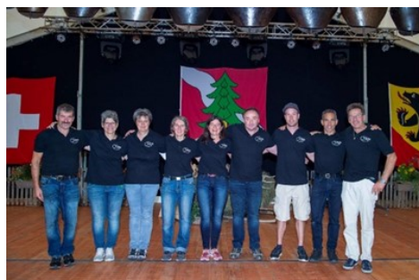
OK 700 Jahre Eriz

Wir nutzen nun diese Gelegenheit um euch allen herzlich zu danken, sei dies für eine finanzielle Unterstützung, euren Einsatz als Helfer, oder ganz einfach als einen freudigen Festbesucher: Herzlichen Dank liebe Erizerinnen und Erizer, für dieses tolle und unvergessliche Jubiläumsfest!