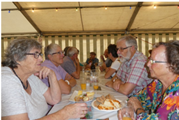
Apéro am 1. August

Wir möchten uns für die Treue zu unserem Tal bei allen ganz herzlich bedanken!